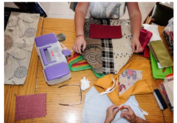
El taller no es sólo un entorno para recuperar habilidades laborales, también es un espacio de terapia