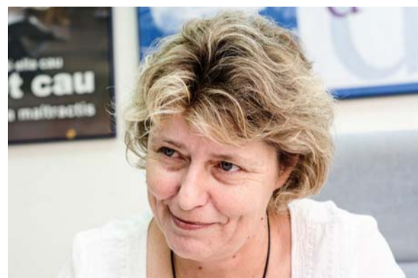
El aumento de la violencia de género entre las jóvenes es un factor que preocupa al Institut

I. LI. En los últimos once años hemos avanzado mucho en los ámbitos legislativo y judicial. En 2003 se pusieron en marcha las órdenes de protección, en 2004 se aprobó la Ley Orgánica de Medidas de Protección Integral contra la Violencia de Género, se han creado juzgados específicos... Pero no es suficiente. Aquí la sociedad tiene que ir a la par. Hasta hace poco la violencia de género era algo que sucedía en el ámbito privado. Ahora ya no es así. La sociedad va tomando más conciencia gracias a las campañas realizadas, a la labor de los medios de comunicación... Nos gustaría ir más allá y tener una sociedad más respetuosa e igualitaria pero afrontar esos cambios culturales más profundos es más lento. Modificar una cultura patriarcal requiere de generaciones.