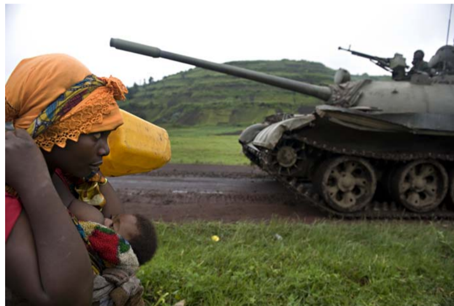
República Democrática del Congo. Una mujer congoleña carga con su hijo y pasa por delante de un tanque perteneciente al ejército congoleño