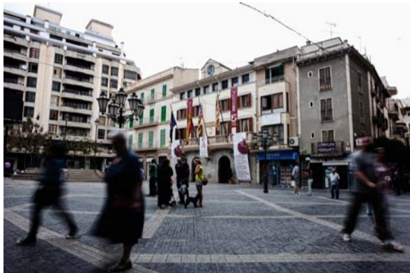
La peatonalización de las calles del centro, convirtió esta zona en eje comercial de la ciudad