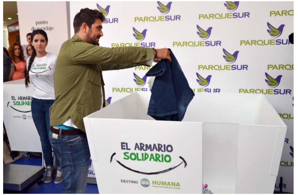
El cantante fue el encargado de depositar la primera prenda en El Armario Solidario en el Centro Comercial Parquesur (Leganés-Madrid)