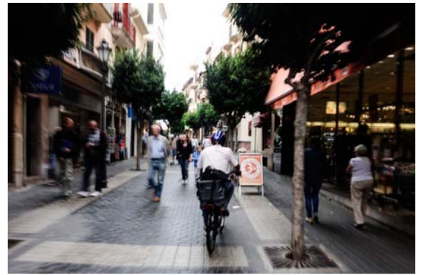
Viandantes y ciclistas comparten espacio en las zonas peatonales

Para implementarlo han diseñado diferentes itinerarios fijos, seguros, sencillos, no muy largos y con paradas intermedias para recoger a los niños. Una serie de padres y madres ejercen, de manera voluntaria, de guías hasta llegar a la escuela. De esta manera, además de contribuir a la movilidad a pie en la ciudad, Camins Escolars se convierte también en una herramienta didáctica al fomentar entre el alumnado un mayor conocimiento del espacio urbano, contribuyendo así a la construcción de una identidad cultural ligada a la ciudad.