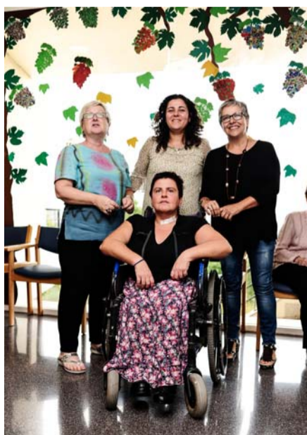
El equipo de Servicios Sociales atendió en 2013 a más de 660 personas