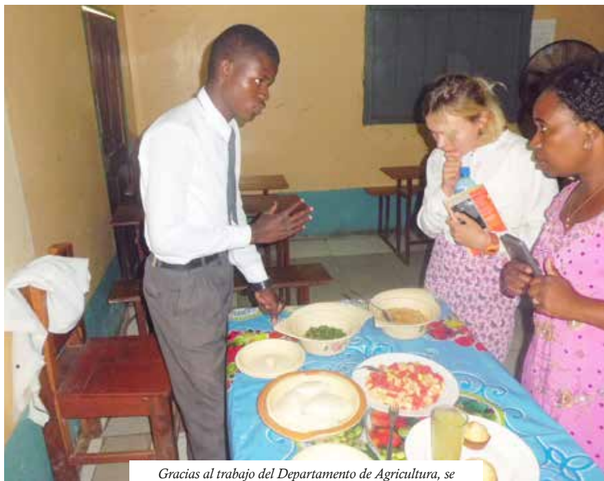
Gracias al trabajo del Departamento de Agricultura, se obtienen alimentos frescos para los estudiantes y el propio staff.