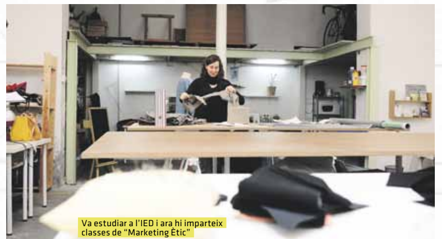
Va estudiar a l'IED i ara hi imparteix classes de “Marketing Ètic”