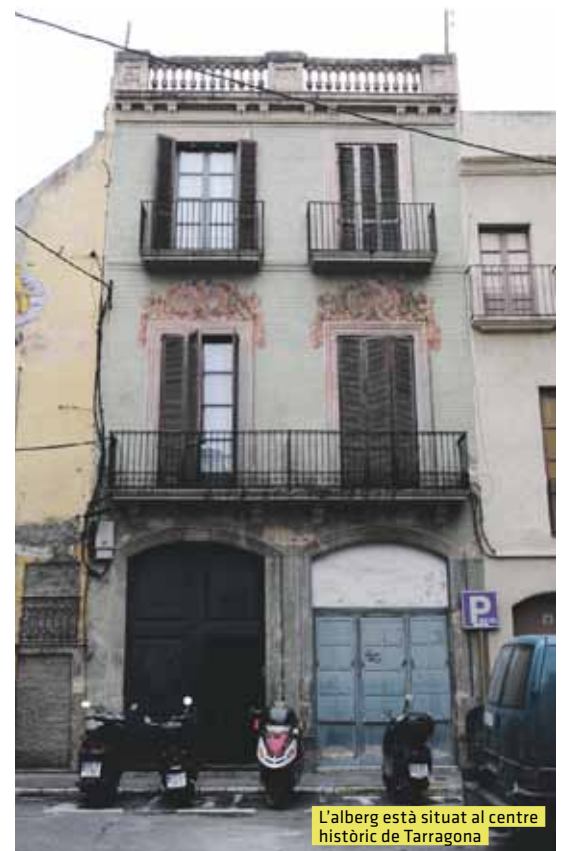
L'alberg està situat al centre històric de Tarragona