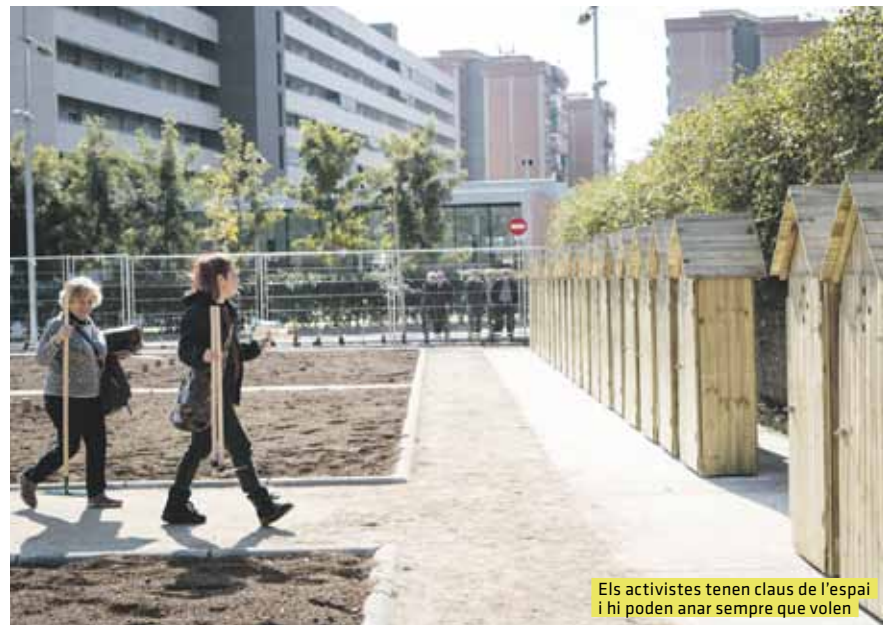
Els activistes tenen claus de l'espai i hi poden anar sempre que volen

L'hort de Cornellà està situat al barri de Sant Ildefons