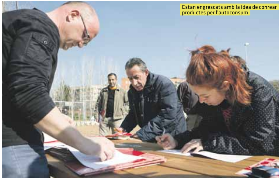
Estan engrescats amb la idea de conrear productes per l'autoconsum

Des de l'Ajuntament expliquen que el projecte és un instrument de suport emocional a les persones més afectades per la crisi. La introducció