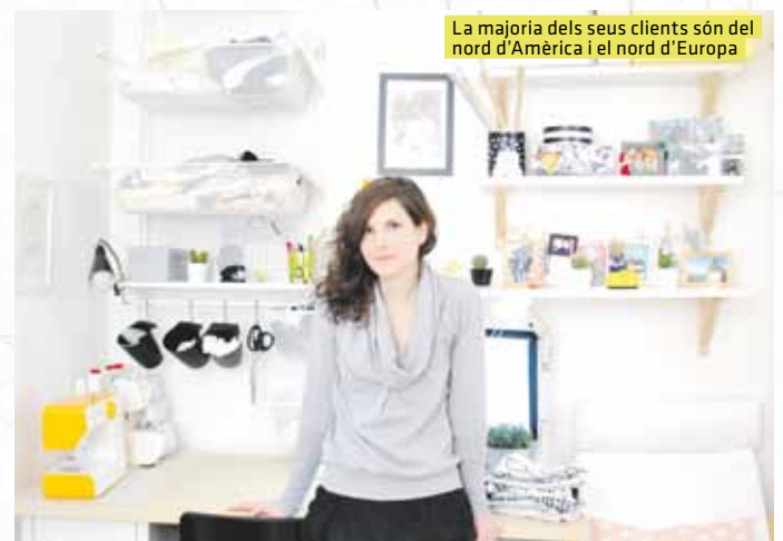
La majoria dels seus clients són del nord d'Amèrica i el nord d'Europa

Els seus clients són principalment foranis, del nord d'Amèrica i el nord d'Europa. Aquí s'estan fent un foradet, amb la confiança de que l'interès creixent per la sostenibilitat i tot allò relacionat amb l'orgànic, que