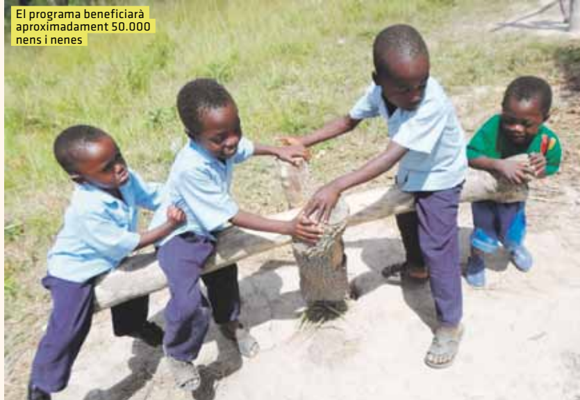
El programa beneficiarà aproximadament 50.000 nens i nenes