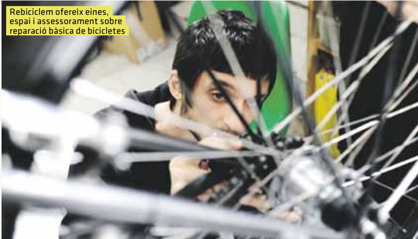
Rebiciclem ofereix eines, espai i assessorament sobre reparació bàsica de bicicletes