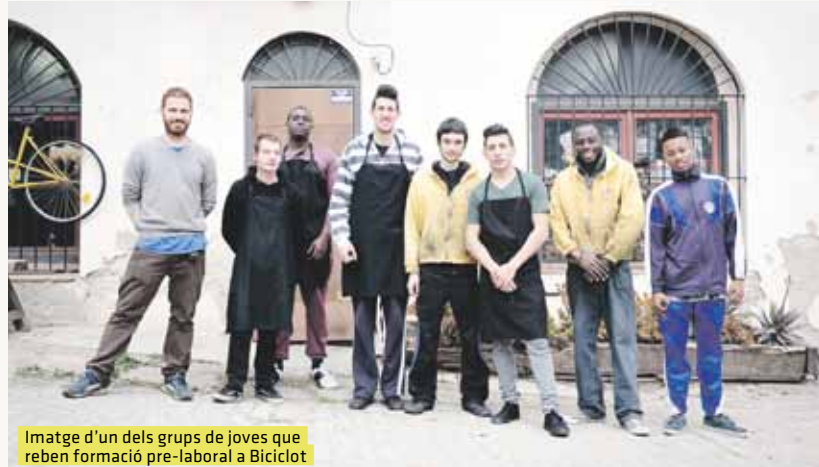
Imatge d'un dels grups de joves que reben formació pre-laboral a Biciclot