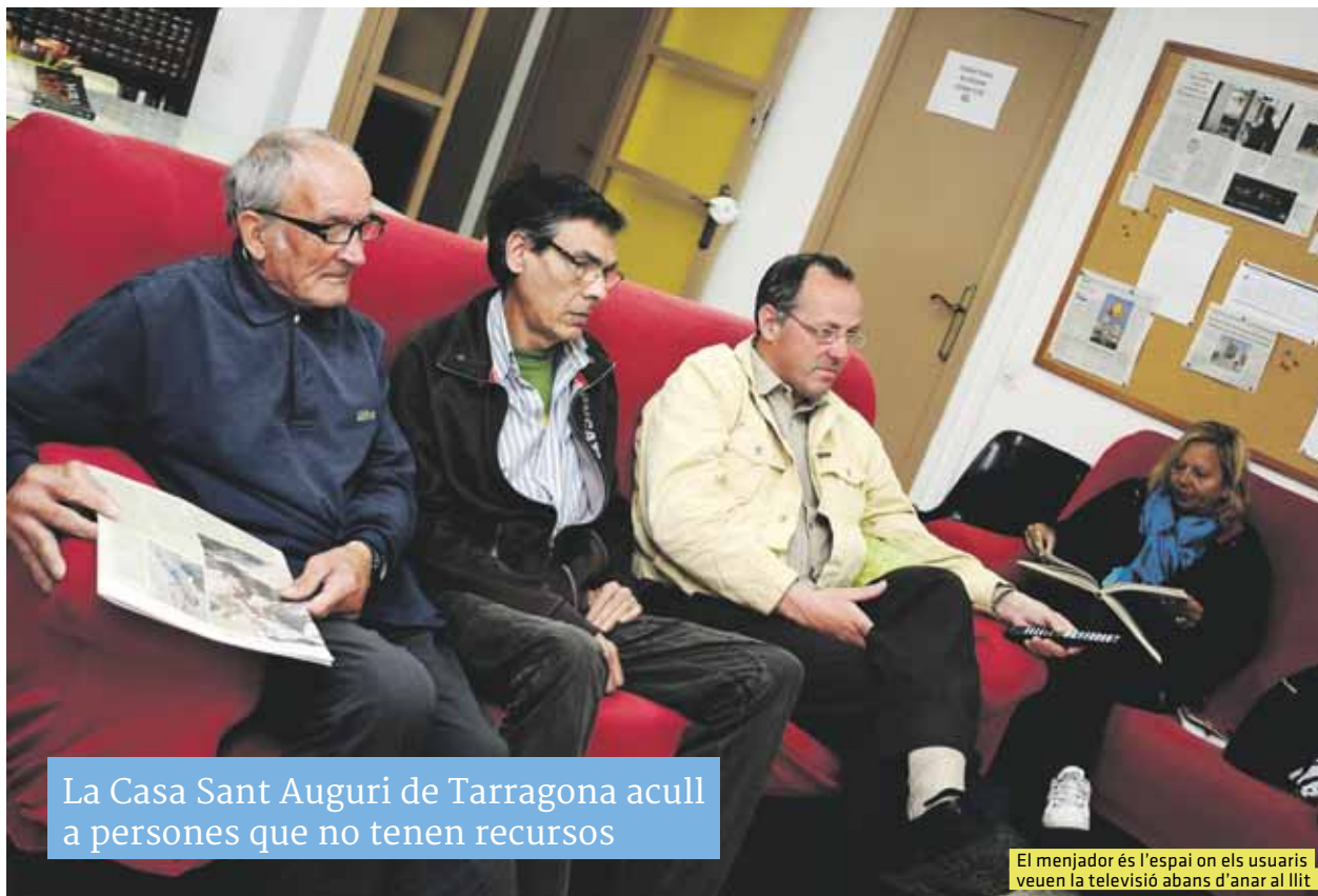
La Casa Sant Auguri de Tarragona acull a persones que no tenen recursos