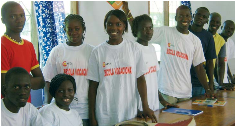
Alumnos de comercio en la Escuela Profesional de Bissora.

La intervención se realizará aprovechando el proyecto de Desarrollo Comunitario de ADPP (contraparte de HUMANA en Guinea Bissau), en marcha desde 1990 y que busca mejorar las condiciones de vida de la población local a través de acciones de desarrollo enmarcadas en diversos