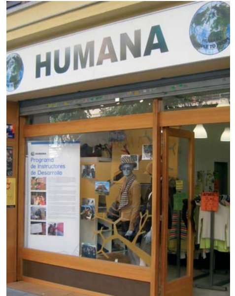
Imagen exterior de la nueva tienda.

Por eso, adquiriendo tu ropa en las tiendas de HUMANA ayudarás a disminuir la creación de estos residuos, y colaborarás al desarrollo de las comunidades y proyectos que financiamos en países en vías de desarrollo del África Subsahariana, como Mozambique, Guinea Bissau o Angola.