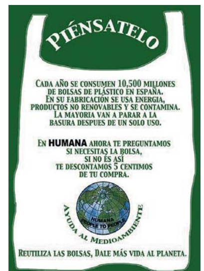
Cartel promocional de la campaña.

requieren bolsa para la ropa adquirida en la tienda. Lo que buscamos con esto es instar a nuestra clientela a reutilizar las bolsas de plástico, ya que en su fabricación se usa energía, productos no renovables y se contamina, y además la mayoría van a parar a la basura tras un solo uso."