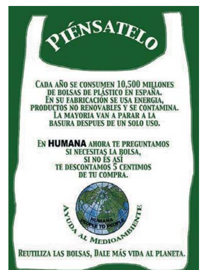
Cartel promocional de la campaña.

requieren bolsa para la ropa adquirida en la tienda. Lo que buscamos con esto es instar a nuestra clientela a reutilizar las bolsas de plástico, ya que en su fabricación se usa energía, productos no renovables y se contamina. La mayoría van a parar a la basura tras un solo uso."