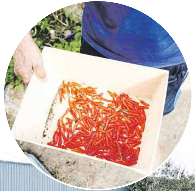
El huerto está situado en las inmediaciones de la nave de Humana en el Polígono Industrial Polvoranca