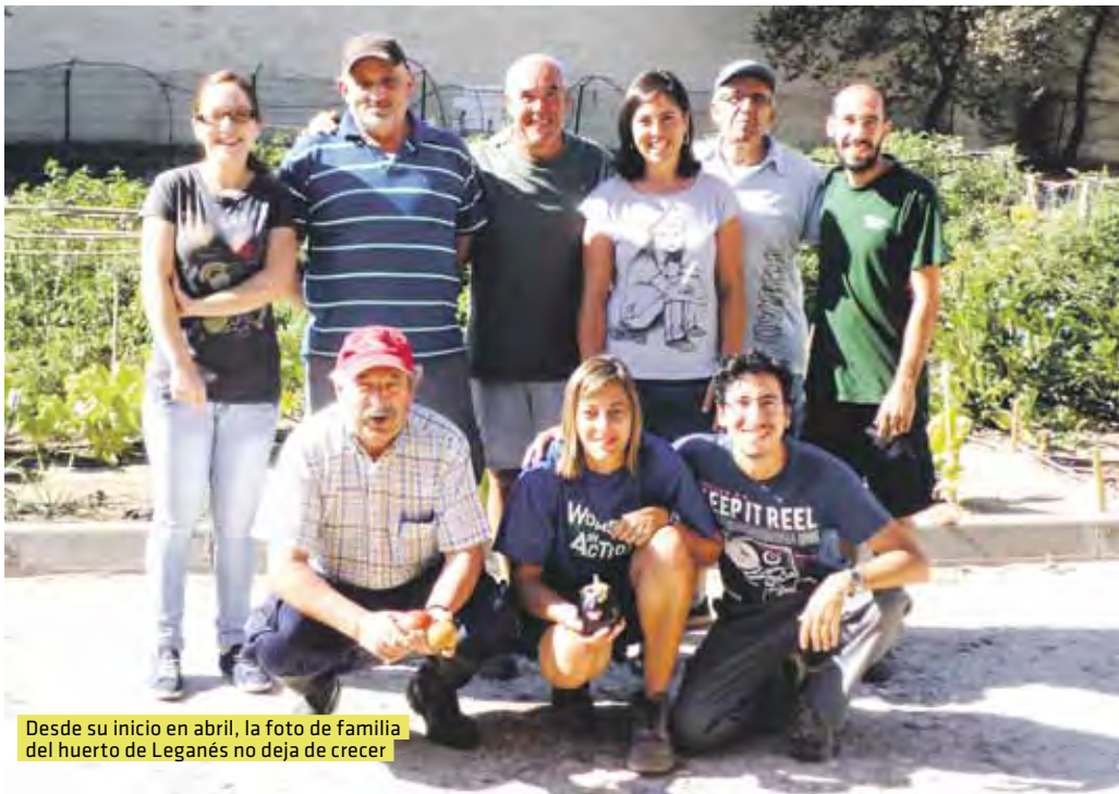
Desde su inicio en abril, la foto de familia del huerto de Leganés no deja de crecer

Humana desarrolla en Leganés un proyecto de agricultura urbana