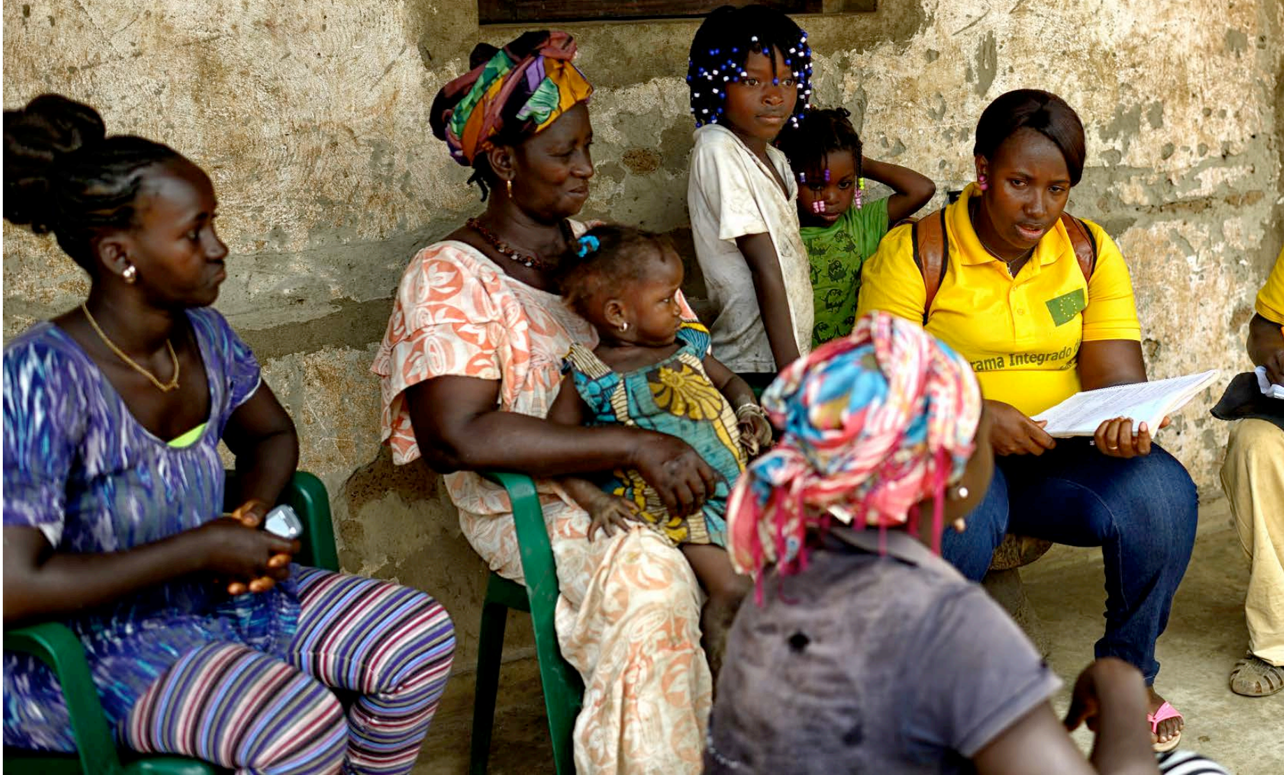
Els Agents Comunitaris de Salut, veïns de les comunitats on hi treballen, estableixen relacions amb les famílies i en controlen l'estat de salut.