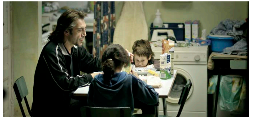
El personatge de Bardem a "Buitiful" lluita pel futur del seus fills.