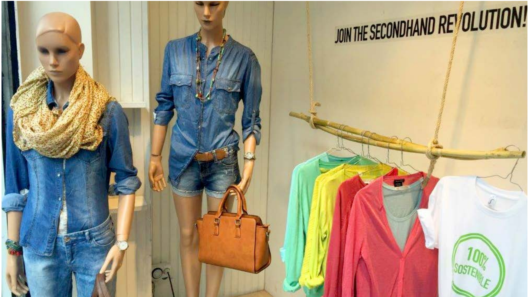
Els aparadors il·lustren la importància de la sostenibilitat en el consum de roba.