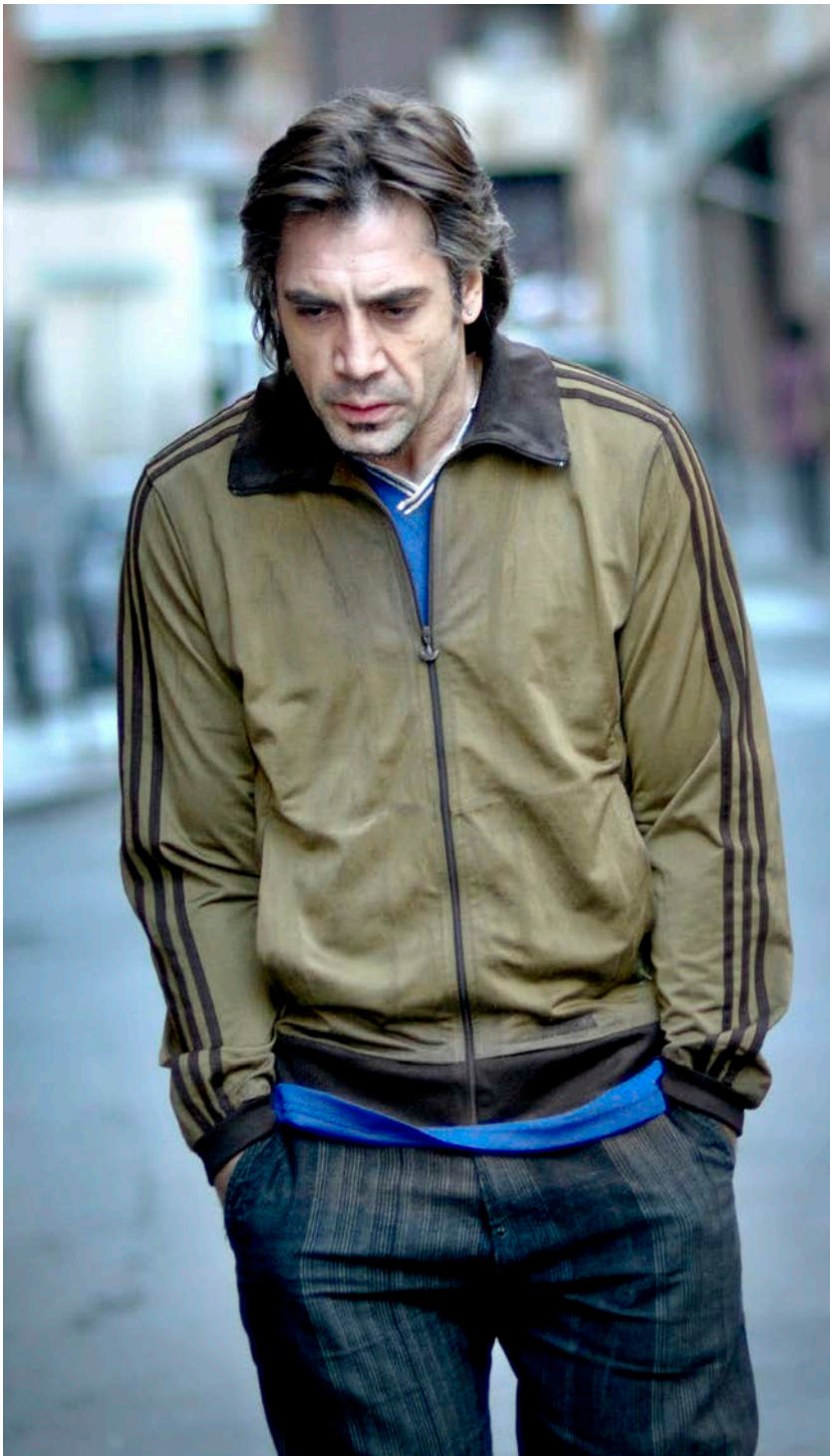
Bardem va obtenir el Goya al millor actor protagonista per "Buitiful".

“ La roba usada aporta credibilitat a la història i als personatges