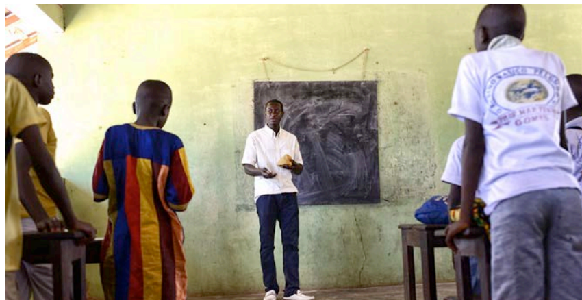
Comptar amb docents ben formats és essencial per a una educació de qualitat en l’hemisferi Sud.

Les organitzacions que formen part d’Humana People to People gestionen mig centenar d’escoles de formació de professors a 12 països. Els docents es preparen per a promoure-hi el desenvolupament local i per a impartir-hi una educació de qualitat. Amb tot això milloren les condicions de l’alumnat i enforteixen la seva comunitat.