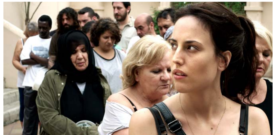
Natalia de Molina va guanyar el Goya a la millor actriu per "Techo y comida".