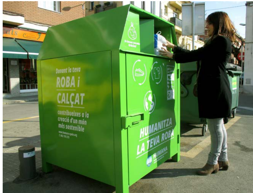
Humana disposa d'uns 1.450 contenidors. A la imatge, un a Cardedeu (Vallès Oriental).