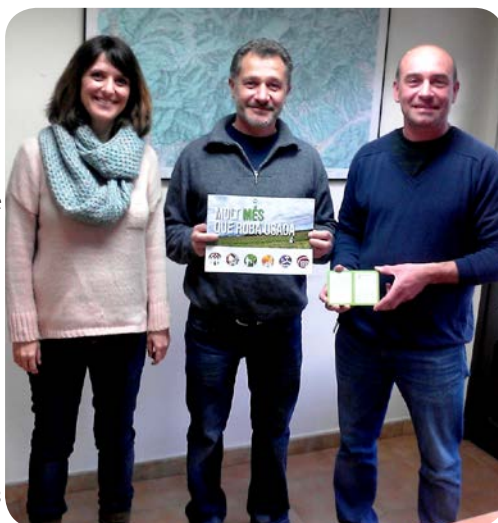
Lliurament de Bons a Gualba (Vallès Oriental).

El lliurament de Bons d'Ajuda creix any rere any: des del 2010, el nombre de vals lliurats s'ha multiplicat per