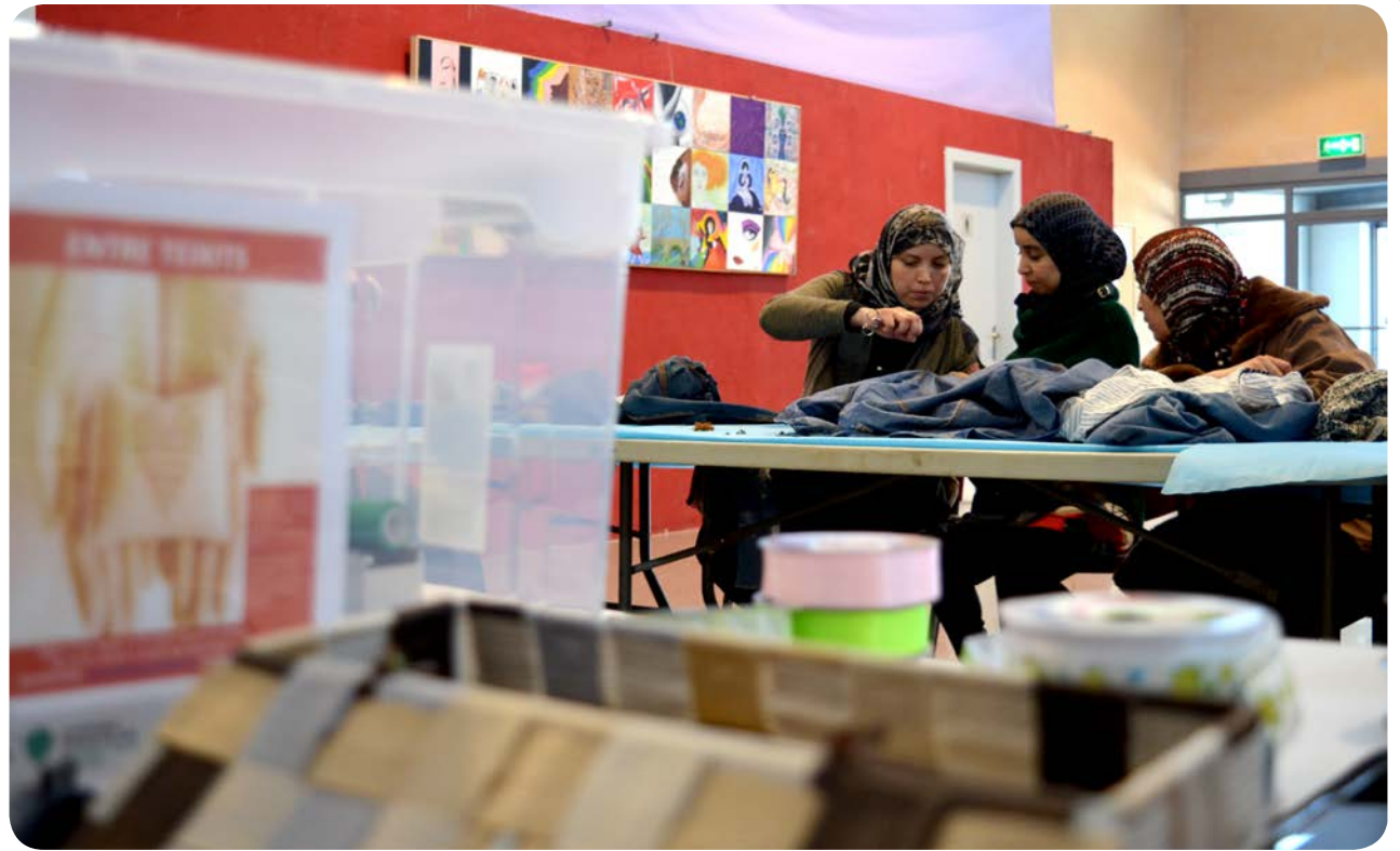
Les usuàries del taller "Entre teixits" són veïnes del barri Santa Anna-Tiò de Premià de Dalt (Maresme).

A Sant Feliu de Guíxols (Baix Empordà) i Castellar del Vallès (Vallès Occidental) col·laborem en el finançament de beques de menjador escolar per a