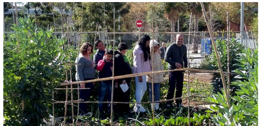
Una de les visites que van fer els alumnes de l'Institut als horts.