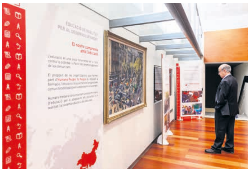
Las exposiciones están formadas por paneles de gran formato con fotografías e ilustraciones.

La educación, el medio ambiente y el papel de la mujer protagonizan nuestras nuevas muestras