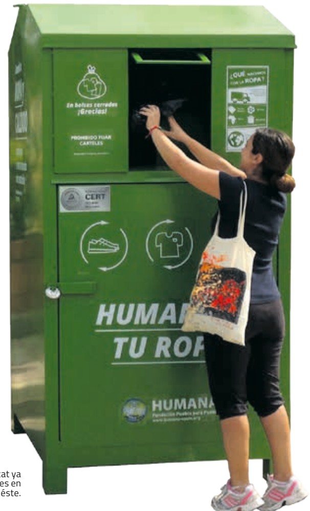
Los vecinos de la Mancomunitat ya pueden efectuar sus donaciones en contenedores como éste.