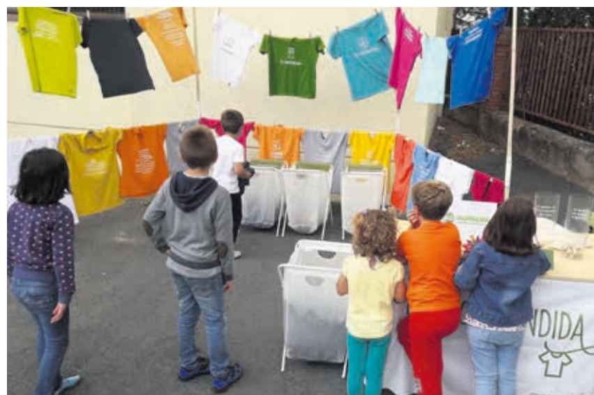
El taller establece dinámicas con las que ayudamos a sensibilizar sobre el valor de la reutilización.

Es evidente que queda mucho trabajo por parte de los ayuntamientos, las empresas, organizaciones como la nuestra y la ciudadanía. Pero la senda que marca “Tejidos Educativos” creemos que es la correcta. ¡No paremos de tejer!