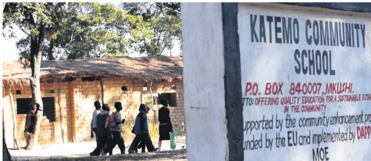
Escuelas como la de Katemo son auténticos motores de desarrollo para el conjunto de la comunidad.

DAPP, socio local de Humana, apoya 160 escuelas comunitarias del país