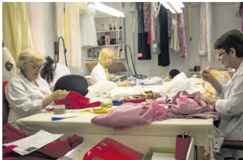
El taller de Caprile, en el barrio madrileño de Salamanca, reúne a un equipo de entre 12 y 13 profesionales.

Sí, lo sé. Hay una que es gigantesca, en Alexanderplatz, que me entró un ataque de ansiedad cuando la vi. También compro en Humana para mis proyectos de teatro o bien para mi colección de ropa vintage . Si como yo, vas mucho y tienes relación con el equipo de la tienda, saben lo que te interesa cuando les llega. El último proyecto teatral que he hecho, con Noviembre, es un Ricardo III, con ropa de Humana.