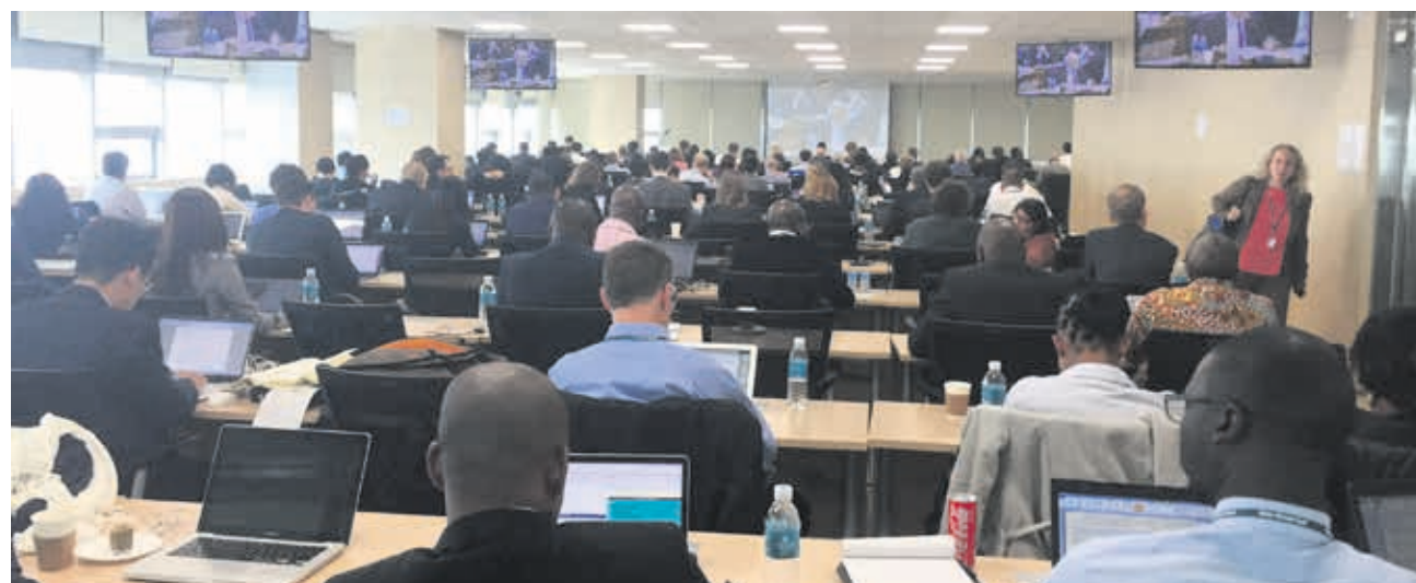
Humana acudió a la reunión para contribuir a las discusiones sobre la gestión del fondo y dar a conocer su labor frente al calentamiento global.

gubernamentales más pequeñas han denunciado ciertas barreras burocráticas que dificultan la obtención de fondos, algo que iría en contra del espíritu del propio GCF.