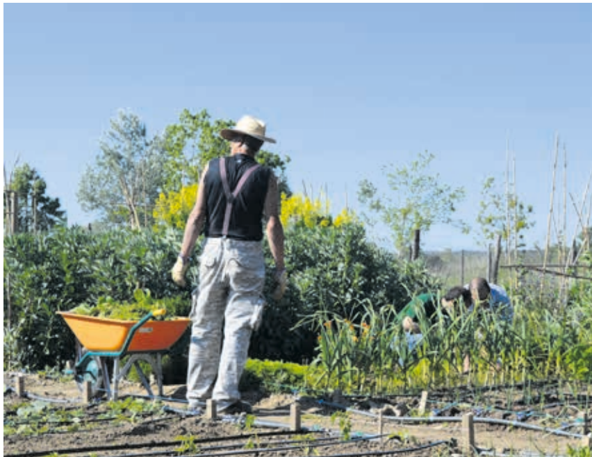
El 3C de Tordera (Barcelona) es uno de los cuatro que actualmente funcionan en Cataluña.

El programa nació en 2014 en Lliçà d'Amunt, en la provincia de Barcelona