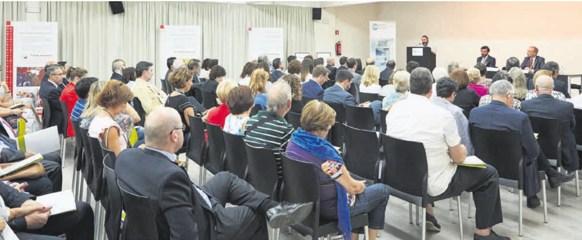
Cientos de colaboradores y amigos han participado en los eventos celebrados en Barcelona, Madrid (en la imagen) y Sevilla.

B arcelona, Madrid y Sevilla han acogido entre los meses de septiembre y noviembre el Humana Day, nuestro gran evento de sensibilización cuya 7ª edición dedicamos a la importancia de impulsar una educación de calidad para conseguir el progreso de las comunidades más desfavorecidas del hemisferio Sur.