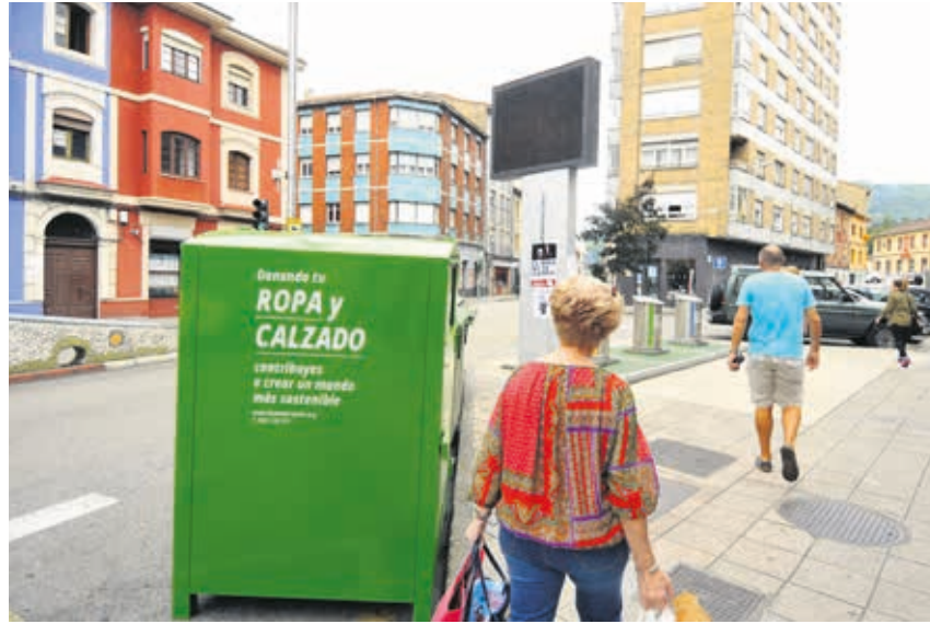
Los contenedores se instalaron en verano (Foto: Fernando Geijo. La Nueva España).

El concejo asturiano de Langreo ha puesto en marcha un plan integral de reciclaje y gestión sostenible de los residuos urbanos, en el que ha incluido la recogida selectiva de textil usado, asumida por Humana. La Fundación instaló el pasado julio 21 contenedores en los que los ciudadanos pueden depositar la ropa de vestir y de hogar, el calzado y los complementos que ya no utilizan. “El Ayuntamiento de Langreo ha demostrado un gran compromiso con el reciclaje y la reutilización”, asegura el responsable en Humana del área de Recogida en Asturias, Ricardo Rodríguez, que añade: “Estamos muy contentos de que cuenten con nosotros y de poder ofrecer este servicio”.