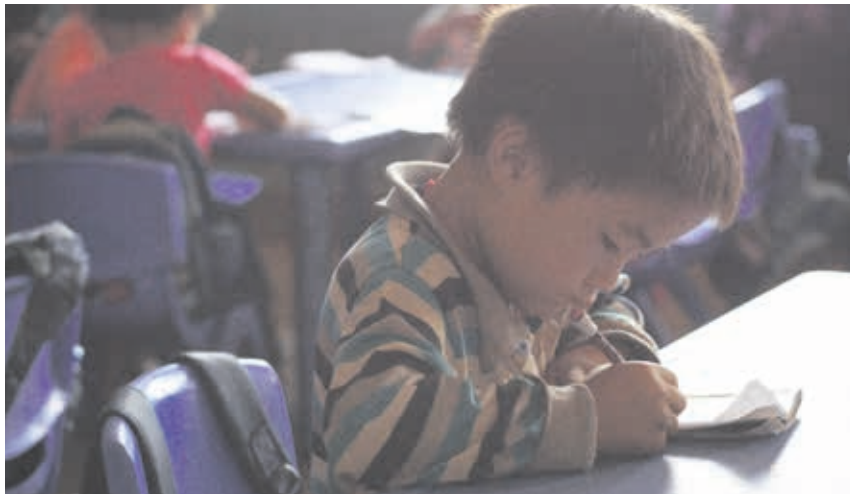
Els centres de preescolar introdueixen als nens en l'aprenentatge en un entorn formal.

Donem suport als mestres per a posar en marxa escoles per als més petits