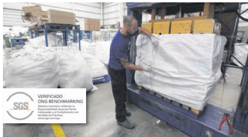
Entre les àrees analitzades per SGS es troben les de recollida i classificació del tèxtil.

Aquest certificat potencia la nostra acreditació com a entitat amb uns alts nivells de professionalitat, bon govern i transparència.