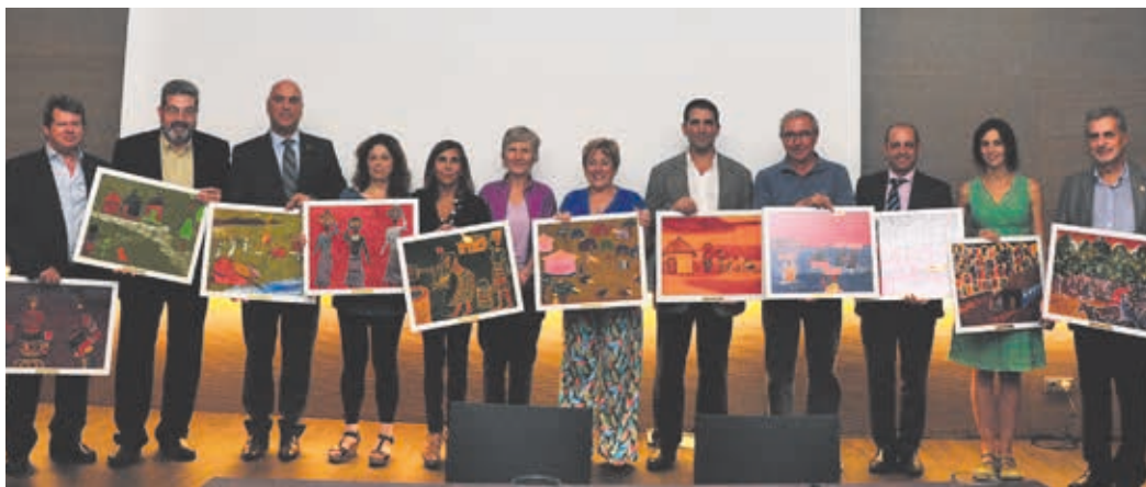
Els premiats a Catalunya, a l'edició del 2013.

Humana compta amb 2.000 col·laboradors a tot Espanya, entre ajuntaments i entitats privades, que confien en la gestió eficaç i professional que fem de la roba usada que donen els ciutadans. Els premis estan dividits en diverses categories: des de la major quantitat de quilos recollits anualment fins al col·laborador amb la major proporció de kg per habitant, passant per la millor ràtio per habitant i contenidor, o el municipi on s'han realitzat més activitats de sensibilització.