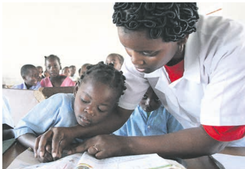
La figura del professor és bàsica per a assolir una educació de qualitat, equitativa i inclusiva.

També ho és, d'altra banda, un compromís d'acció cívica i social basat en un sentit de la pròpia interconnexió amb els altres, ja siguin veïns o estranys. Per això, bona part de les organitzacions que formem part d'Humana People a Europa duem a terme programes de sensibilització en centres escolars, abordant qüestions mediambientals i socials, i promovent el diàleg sobre aquestes qüestions.