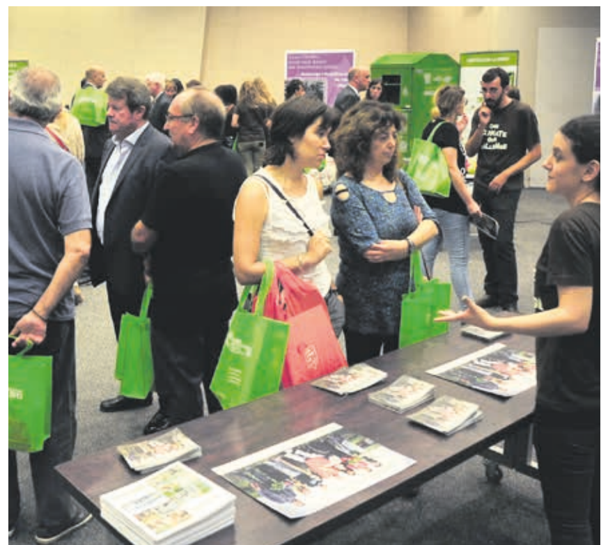
Un moment de l'Humana Day celebrat a Barcelona al 2013.

El darrer dijous del mes concentrarem les activitats per a tots els nostres col·laboradors