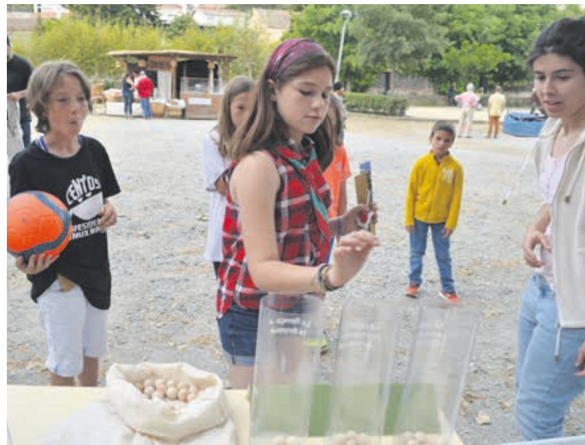
El taller va ser estrenat a Dosrius (Vallès Oriental), dins del marc de l'Ecofira.

El taller fomenta la participació, aclareix dubtes i mostra què hi ha darrera de la recollida de roba