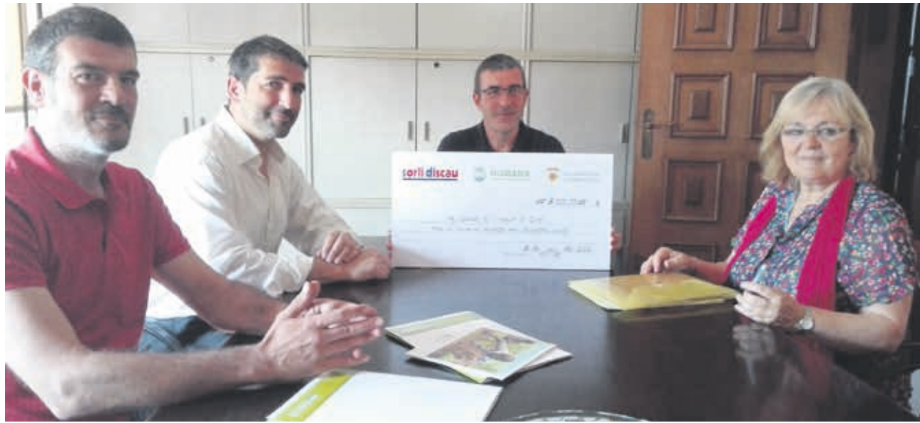
L'acte de lliurament a l'alcalde va tenir lloc a la Casa Consistorial del municipi maresmenc.

La gestió del tèxtil usat, recollit als contenidors instal·lats als supermercats, permeten obtenir-ne els recursos per aquesta donació