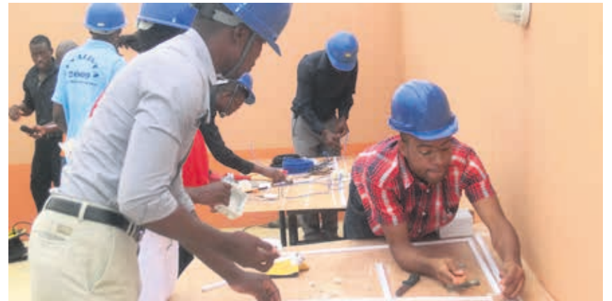
Als centres de capacitació professional es forma als joves en àmbits com l'energia i l'electricitat.

A Moçambic , el nostre soci local ha signat recentment un acord amb un dels centres de formació preferits per una de les grans empreses constructores del país. D'altra banda, els graduats compten amb el suport per buscar ocupació o començar el seu propi negoci.