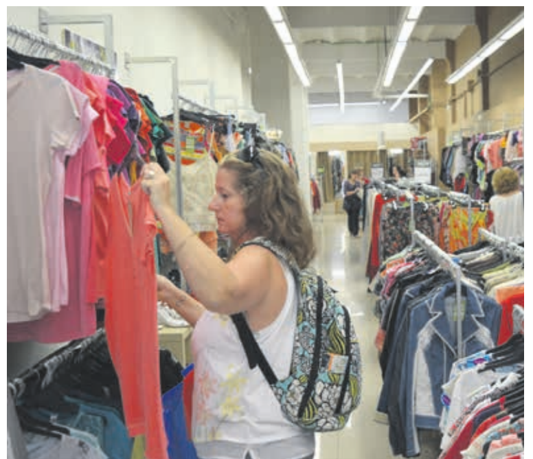
La botiga de la Ronda de Sant Antoni, a Barcelona, es va inaugurar el passat mes de maig.

També hi trobem els amants de la reutilització; els que volen contribuir a la protecció del medi ambient sense renunciar-ne a la qualitat: els que van a la recerca de “joies úniques” en forma de faldilles o vestits vintage: els dissenyadors que pretenen peces per realitzar-hi després creacions pròpies o d’ upcycling ; les productores de televisió, cinema i teatre que necessiten un tipus de vestuari que difícilment trobaran en un altre tipus de botigues... La varietat de motius i edats és tan gran, que això és precisament el que enriqueix el dia a dia dels nostres establiments.