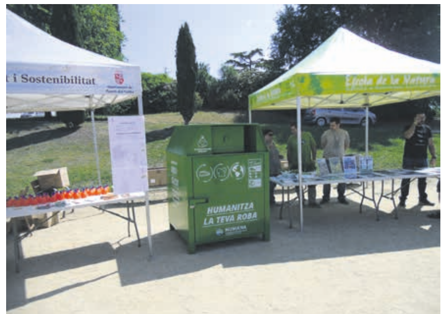
Parets del Vallès va organitzar diverses activitats al Parc Cal Jardiner.

L'any passat, vam recollir gairebé 23 tones al municipi vallesà, la qual cosa representa un estalvi de 72 tones de CO 2 que no s'han emès a l'atmosfera. I és que la reutilització i el reciclatge de tèxtil contribueixen a la protecció del medi ambient en reduir en part els residus generats per la ciutadania: cada kg de roba que es reutilitza i no és incinerat evita l'emissió de 3,169 kg de CO 2 , segons dades de la Comissió Europea. Això té un benefici evident per al planeta.