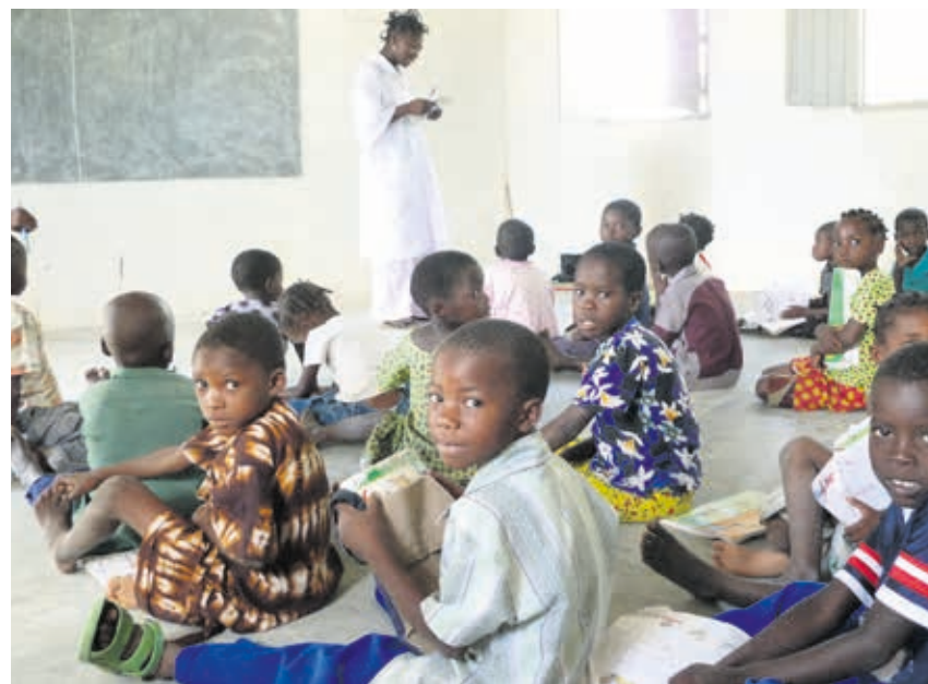
Actualment hi ha 83 milions de nens i nenes més a l'escola que al 1999.

En els més petits, això significa fomentar els valors que volem veure en la societat d'avui i del futur. En els graduats de secundària, es tradueix